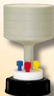
SMART WASTE CAPS