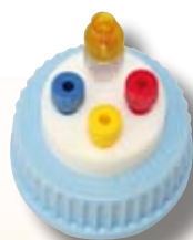
SMART HEALTHY CAPS